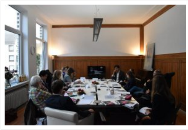
Norddeutsche Festivalmacher und TONALi