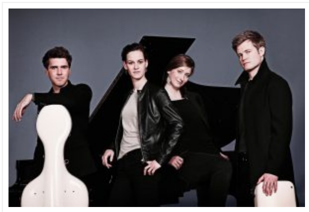
— Notos Quartett

Veröffentlicht am 7. Mai 2018 von Wibke Heß