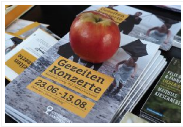
— Programmheft mit Apfel, Foto: Karlheinz Krämer

136 Programmhefttext-affine Konzerte, 200 verschiedene Komponisten mit 674 Werken (inkl. Mehrfachaufführungen)